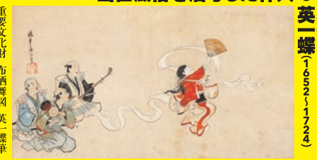
重要文化財 布疋舞図 英一蝶筆 江戸時代(7世紀) 埼玉・遠山記念館